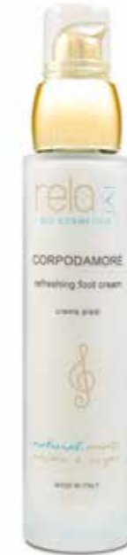
Crema piedi Refreshing foot cream 50 ml