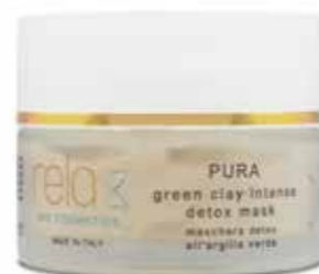
Maschera detox all'argilla verde Green clay intense detox mask 50 ml

I prodotti Relax Bio Cosmetics nascono dal desiderio profondo di avvicinare ad uno stile di vita consapevole e sostenibile più persone possibili.