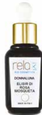
Elisir di rosa mosqueta Rosa mosqueta elisir 30 ml