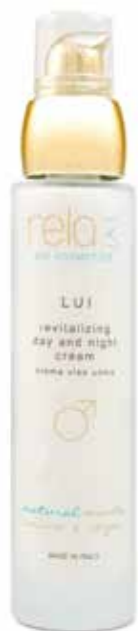
Crema viso uomo Revitalizing day and night cream 50 ml

Super-concentrated fluid to counteract the signs of aging. Non-greasy, it has an immediate lifting effect. Thanks to its special and innovative formula it has a botox-like smoothing action on the expression lines of the eye contour; stimulates the production of collagen and elastin, restores the optimal degree of hydration and contrasts bags and dark circles acting on the microcirculation.