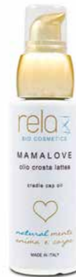
Olio crosta latte Cradle cap oil 50 ml