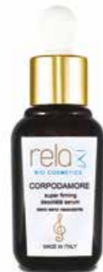
Siero seno rassodante Super firming bust cream 30 ml