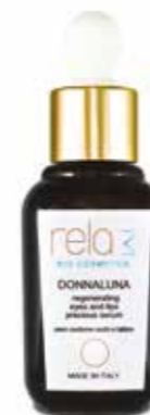
Siero contorno occhi e labbra Regenerating eyes and lips precious serum 30 ml

Standard elevati. Ingredienti naturali. Bellezza olistica.