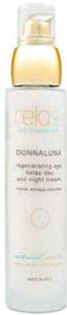
Crema antiage naturale Regenerating age delay day and night cream 50 ml