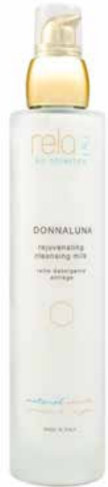
Latte detergente antiage Rejuvenating cleansing milk 100 ml

DONNALUNA is the antiage line that supports productive skin renewal, refining skin and energizing its regenerative processes for a firmer, smoother, radiant appearance. Natural products that regenerate, nourish in depth, soften the signs of time, make the queen in you show up and glow.