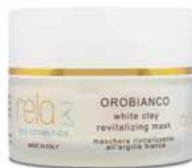
Maschera rivitalizzante all'argilla bianca White clay revitalizing mask 50 ml