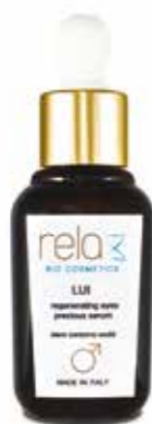
Siero contorno occhi Regenerating eyes precious serum 30 ml