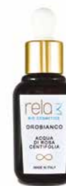
Acqua di rosa centifolia Rosa centifolia flower water 30 ml