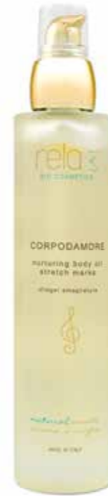
Oliogel antismagliature Nurturing body oil, stretch marks 100 ml