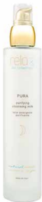
Latte detergente purificante Purifying cleansing milk 100 ml