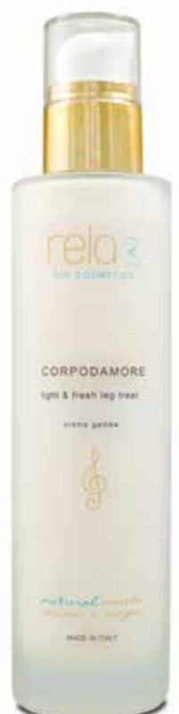
Crema gambe Light and fresh leg treat 200 ml