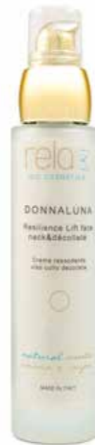
Crema rassodante viso, collo e décolleté Resilience lift face neck & décolleté 50 ml