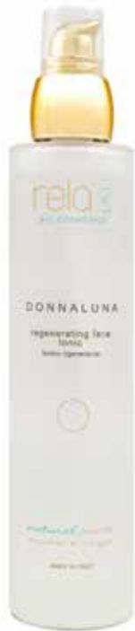
Tonico rigenerante Regenerating face tonic 100 ml