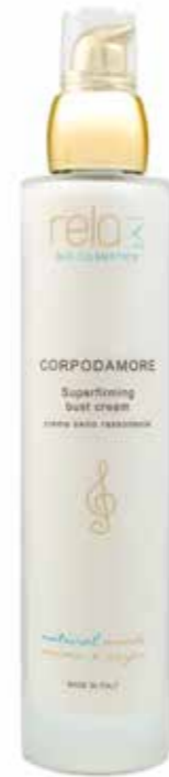
Crema seno rassodante Super firming bust cream 100 ml