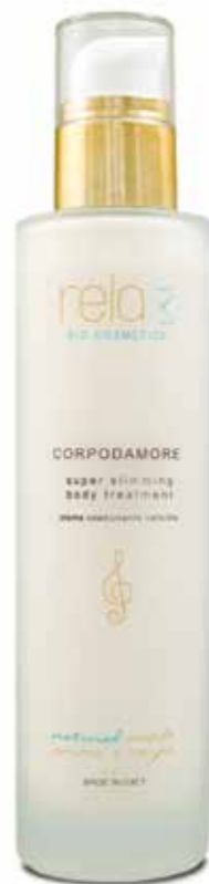
Crema coadiuvante cellulite Super slimming body treatment 200 ml