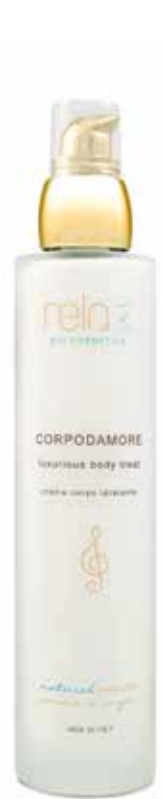
Crema corpo idratante Luxurious body treat 100 ml

Relax Bio Cosmetics is a luxury rejuvenation and regeneration organic spa and skincare line designed to heal and nourish the skin, and uplift the emotions, drawing its inspiration from Mother Nature's bounty and fusing the wisdom of the tradition with the wonders of modern, supercritical extraction technology.