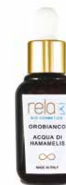
Acqua di hamamelis Hamamelis leaf water 30 ml