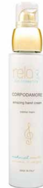
Crema mani Amazing hand cream 50 ml