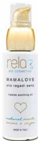
Olio ragadi seno Nipples soothing oil 50 ml