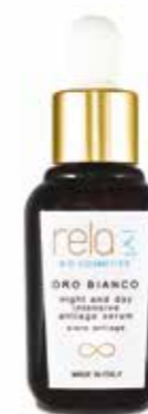
Siero antiage Night and day intensive antiage serum 30 ml