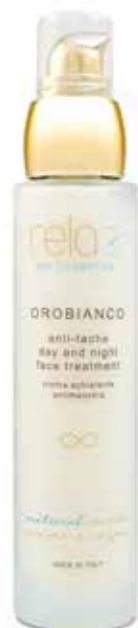
Crema schiarente antimacchia Anti-tache day and night face treatment 50 ml