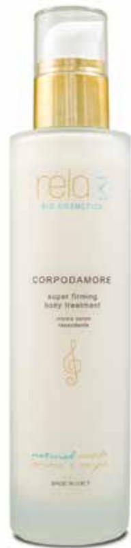
Crema corpo rassodante Super firming body treatment 200 ml