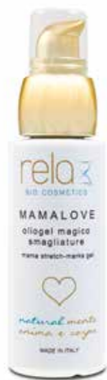
Oliogel magico antismagliature Mama stretch-marks gel 50 ml

In our line for mama and baby we poured all of our hearts: completely natural formulations, vegan, fragrance-free, safe at every stage of pregnancy and for babies, to protect, heal and take care of the most precious skins ever.