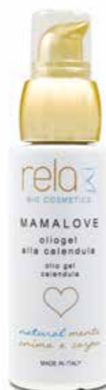
Oliogel alla calendula Calendula oil 50 ml