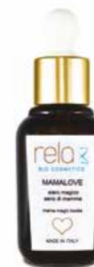
Siero magico seno di mamma Mama magic boobs 30 ml