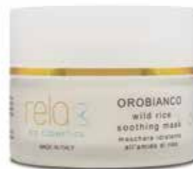
Maschera idratante all'amido di riso Wild rice soothing mask 50 ml