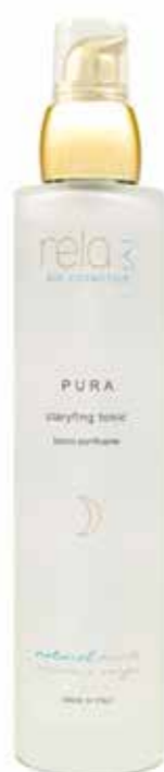
Tonico purificante Clarifying tonic 100 ml