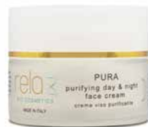
Crema viso purificante Purifying day and night face cream 50 ml